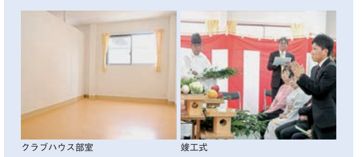
クラブハウス部室 竣工式